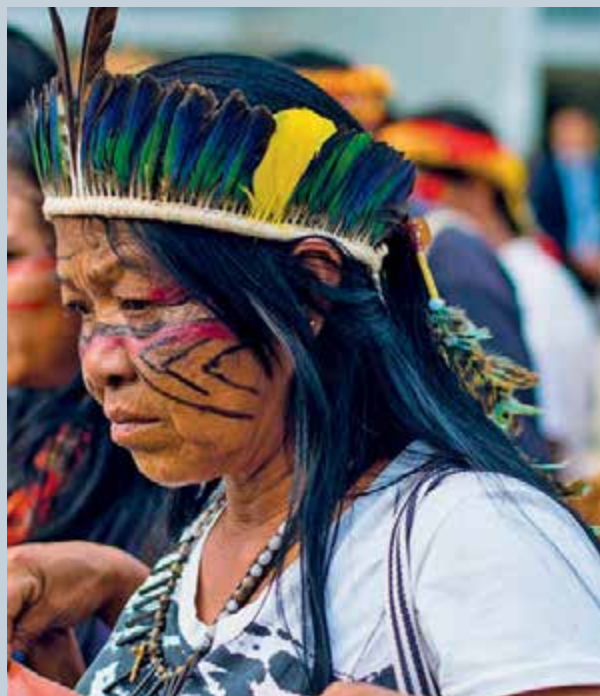
© Tiago Micotto / CIMI, 2016