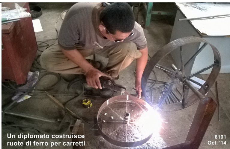
Un diplomato costruisce ruote di ferro per carretti

Questa semplice seminatrice per granoturco e soya rende il lavoro più facile, efficiente ed economico.