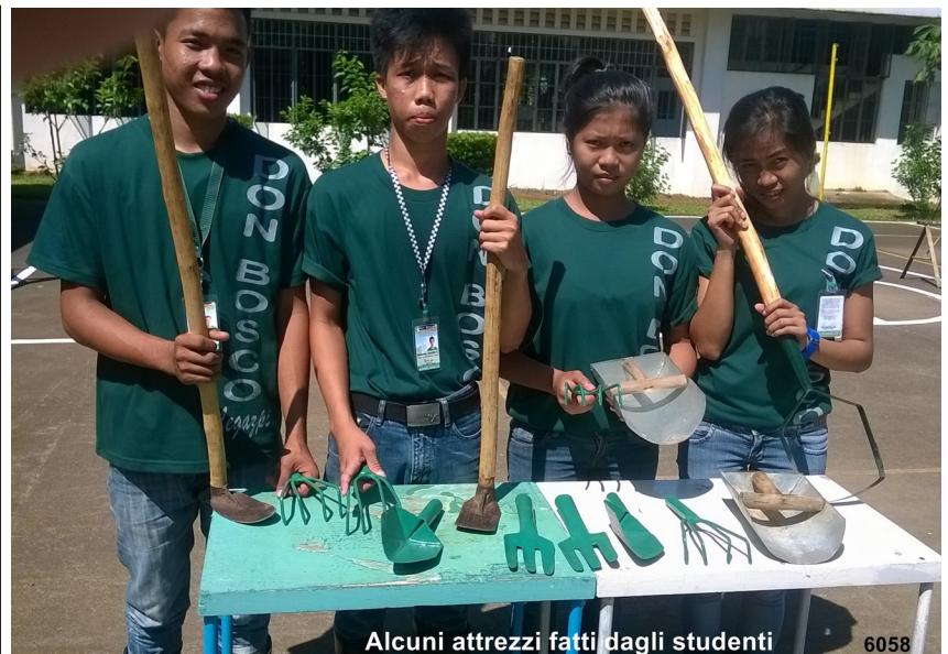
Alcuni attrezzi fatti dagli studenti