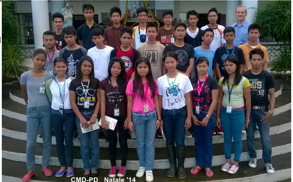
CMD-PD Natale '14

Una attivita' speciale che stiamo sviluppando e' la fabbricazione di semplici attrezzature agricole, adattando e comprando alcuni macchinette semplici ma importanti nel lavoro agricolo.