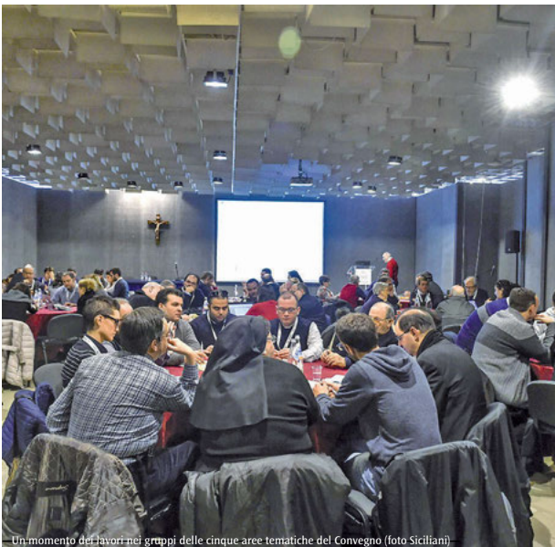
Un momento dei lavori nei gruppi delle cinque aree tematiche del Convegno